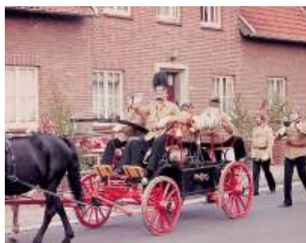
Die K.B. Feuerwehr in historischen Uniformen beim Umzug

Wir würden uns wünschen, dass mehr Bürger von Isernhagen den Spaß an der Feuerwehr und Kameradschaft für sich entdecken und mit uns die Begeisterung für den Feuerwehrdienst teilen.