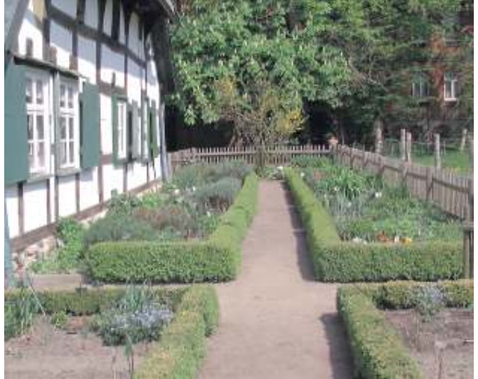
Der idyllische Wöhler-Dusche-Hof in Isernhagen N.B. ist Schauplatz der Theateraufführung der Plattdeutschen Runde