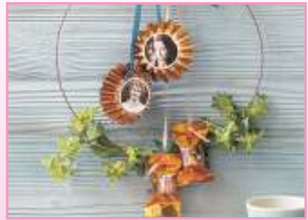
Den Fotokranz mit Geschenkband zum Muttertag kann man an einer Wand aufhängen.

So wird's gemacht: Stäbchen mit Sprühlack einfärben, trocknen lassen. Nach Vorlage Herzen und Etiketten aus Bastelkarton ausschneiden. Herzen mittig falten und wieder öffnen, sodass ein 3-D-Effekt entsteht. Herzen mit Klebeband an Box befestigen. Etiketten lochen, mit Essens- einladung beschriften. Rotes Garn durch Löcher fädeln, am Henkel der Box verknoten. Box mit Seidenpapier auskleiden, mit Stäbchen und Valentinstagsherz in Szene setzen.