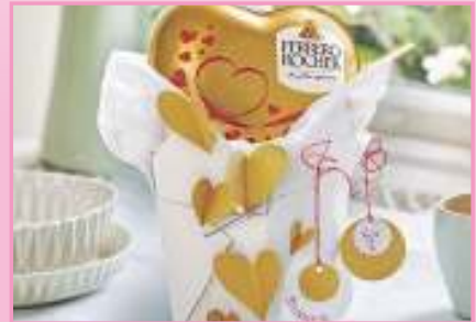
Mit diesem "herzvollen" Geschenk zum Valentinstag macht man seinem oder seiner Liebsten ganz bestimmt eine Freude.

So wird's gemacht: Pappbuchstaben mit Sprühlack einfärben, trocknen lassen. Pralinen mit doppelseitigem Klebeband auf Buchstaben befestigen. Etikett nach Vorlage aus Strukturpapier ausschneiden, mit Buchstabenstempeln "APA" bestempeln. Etikett mit verziertem Pappbuchstaben arrangieren.